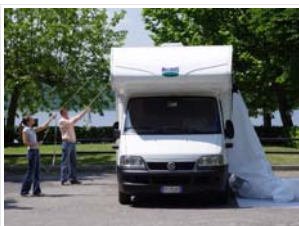
Sistema di montaggio con corde, per issare il telo sul camper facilmente e senza l'uso di scale