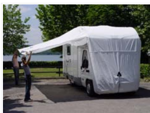
Doppia cerniera lato porta, per un facile accesso alla parte abitativa