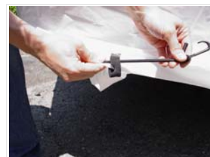
la coulisse permette di stringere la parte anteriore e posteriore

Il telo copricamper viene realizzato in taglie studiate per proteggere i camper dalle dimensioni più comuni in commercio